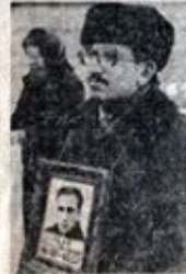
Н. МЕЛНИКОВ. На фото: участники Недели совести в Оренбурге.

В этот день в Оренбурге, в Библиотеке, собралась большая группа людей, в которой были представители различных организаций, в том числе и представители органов власти. И в этот день в Оренбурге, в Библиотеке, собралась большая группа людей, в которой были представители различных организаций, в том числе и представители органов власти.