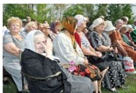
Детей и внуков репрессированных год от года становится все меньше