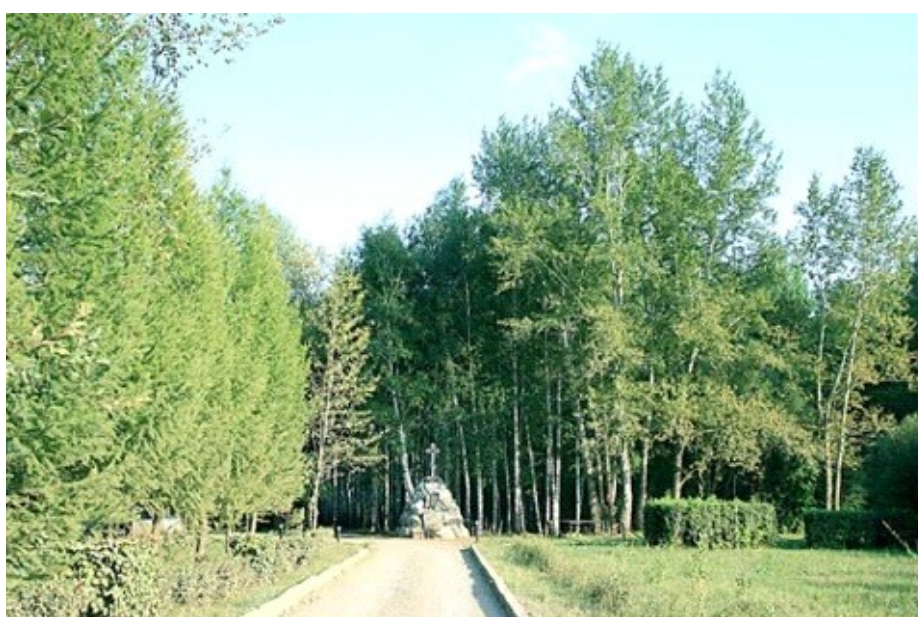
Фото 2007 год. Памятник на мемориале Памяти

Настоящая книга, созданная Оренбургским движением «Мемориал», содержит сведения о невинно репрессированных оренбуржцах,