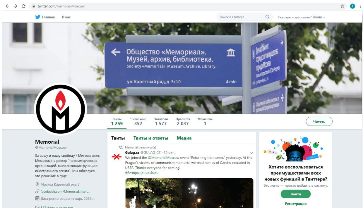
Скриншот с официального Twitter-аккаунта «Мемориала» по адресу: twitter.com/MemorialMoscow на 05.11.19